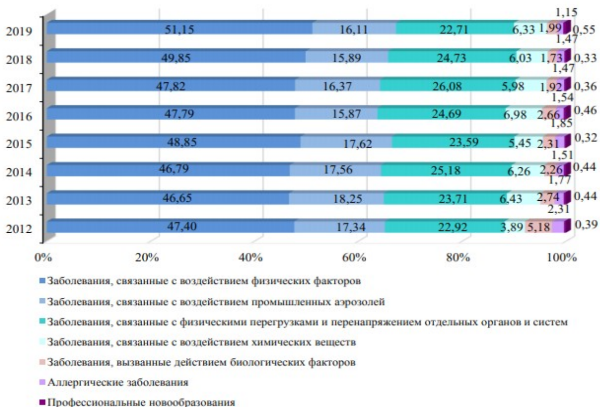
Структура профессиональной патологии в зависимости от воздействующих факторов трудового процесса, %

В структуре профессиональной патологии в зависимости от воздействующего вредного производственного фактора по-прежнему на первом месте профессиональная патология вследствие чрезмерного воздействия на организм работников физических факторов производственных процессов – 49,85 %. Второе ранговое место за профессиональной патологией вследствие воздействия физических перегрузок и перенапряжения отдельных органов и систем – 24,73 %. Третье и четвертое места соответственно за профессиональными заболеваниями от воздействия промышленных аэрозолей – 15,89 % и заболеваниями (интоксикациями), вызванными химическими веществами – 6,03 %. Доля профессиональной патологии от воздействия других вредных производственных факторов составляла 3,5 %.