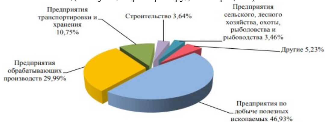
Структура профессиональной заболеваемости по основным видам экономической деятельности, %